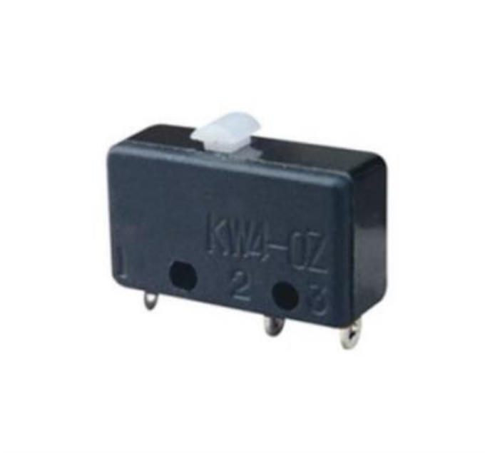
Рис. 1 Микрорелекючателъ KW4-OZ