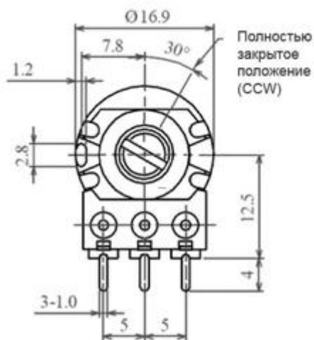
Размещение монтажных отверстий в плате