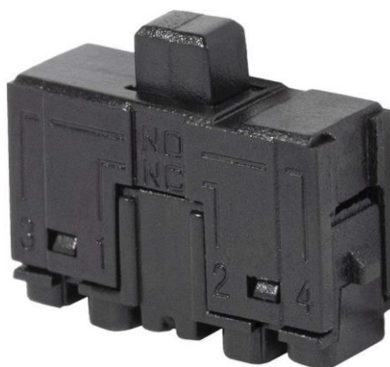
Рис. 2 ХТМ-1300

ХТМ-1300, ХТМ-1301 — микропереключатель с механическим приводом, производитель — RUICHI.