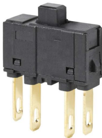
Рис. 1 ХТМ-1301