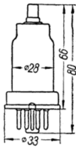
Основные размеры лампы 6К7.

(пентод высокой частоты с удлиненной характеристикой)